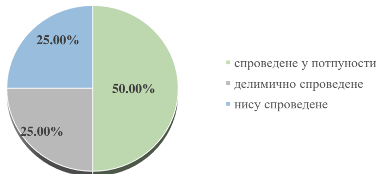
Четврта мера - Обезбеђивање предуслова за дигитализацију поступака

Пета мера - Обуке за оптимизацију административних поступака и информативна кампања. У извештајном периоду су спроведене све три активности. Одржане су четири дводневне обуке на тему оптимизације административних поступака, на којима је присуствовало 92 полазника, организована конференција на којој су представљене реформске активности у оквиру Програма еПАПИР - 08.10.2019. године – „Од шалтера до дигиталне трансформације“ посвећена представљању досадашњих резултата и будућих планова. Одржано је 7 радионица са 174 службеника запослена у јединицама локалне самоуправе на тему оптимизације административних поступака на локалном нивоу и то у Београду, Новом Саду, Краљеву, Зрењанину, Панчеву, Новом Пазару и Смедереву, на којима је учествовало 174 полазника.