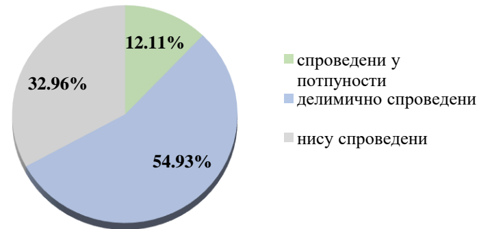
Трећа мера - Оптимизација административних поступака

Четврта мера - Обезбеђивање предуслова за дигитализацију поступака – Предвиђа четири активности од којих су две у целости спроведене, односно израђена је детаљна анализе и дизајн платформе за дигитализацију и успостављена је платформа за дигитализацију (е-Дозволе), док су друге две активности прекинуте услед проглашења пандемије Корона вируса. Активност која се односи на дигитализацију 30 административних поступака је у целости извршена до тестирања које је требало да започне 15. марта 2020 године, али је померено на 1. јун 2020. године услед већ поменутих разлога- Четврта активност је условљена трећом јер се односи на обуку 30 државних службеника који ће спроводити дигитализоване поступке, што није било могуће започети пре завршетка тестирања дигитализованих поступака.