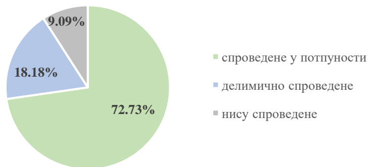
Спровођење Акционог плана у извештајном периоду

Прва мера - Успостављање управљачке-организационе структуре ради унапређења управљања Програмом је обухватиле три активности које су у целости спроведене у постављеним роковима и које се односе на: